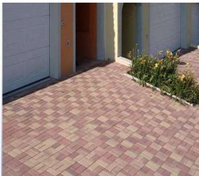
Exemples de Calpinage