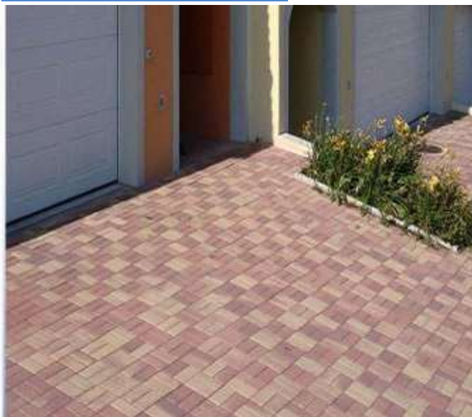
Exemples de Calpinage