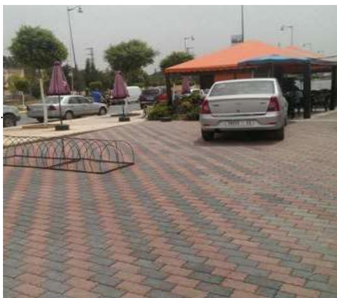
Exemples de Calpinage