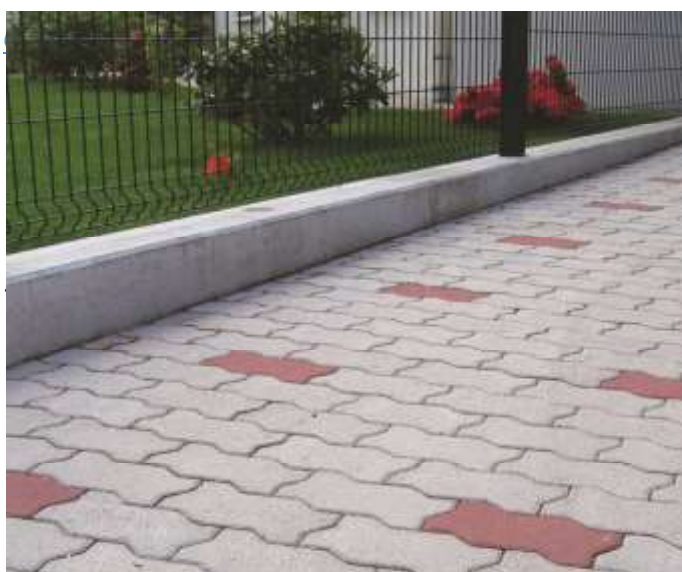
Exemples de Calpinage

Comme le pavé PAC ce pavé est autobloquant dans toutes les directions et peut être posé suivant toutes les configurations que l'on pourrait réaliser avec un simple rectangle.