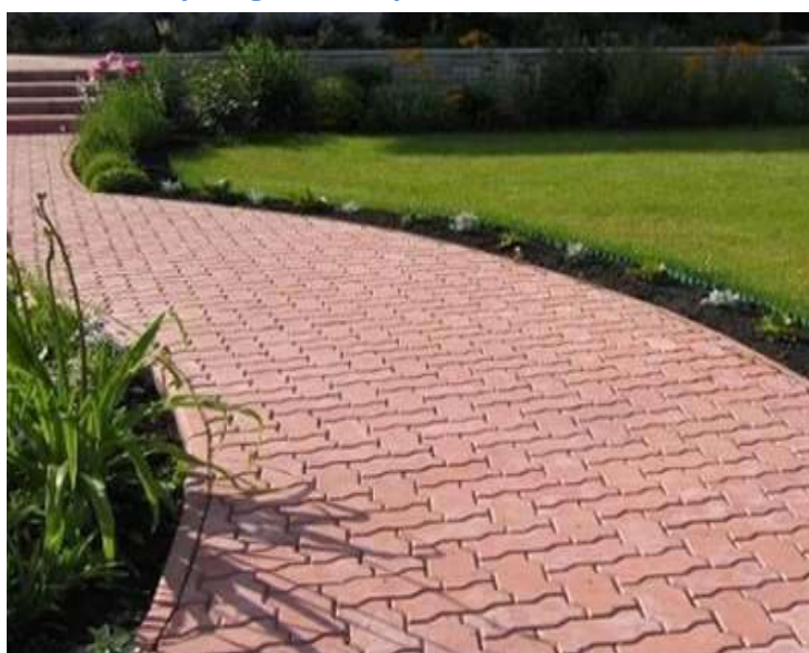
Exemples de Calpinage